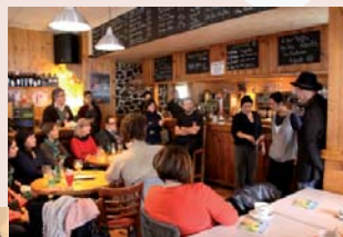
Apéro-contes au Café Le France