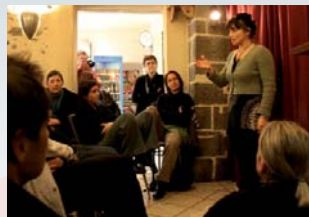
Apéro-contes au Café Le Médiéval

Le Médiéval, Le Canotier, Le France, le café associatif La Loupiote ainsi que le bar du théâtre d'Aurillac accueilleront ces moments conviviaux gratuits et souvent inattendus.